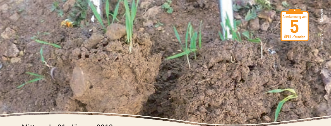
Anerkennung von 5 ÖPUL-Stunden