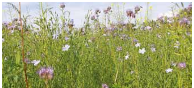
Als Begrünung sollten immer (möglichst vielfältige) Gemenge angebaut werden.

ACHTUNG: Pflanzenarten, die regelmäßig als Hauptfrucht im Betrieb angebaut werden, sollten nicht zusätzlich auch im Begrünungsanbau zum Einsatz kommen. Dies betrifft im Besonderen Körnerleguminosen.