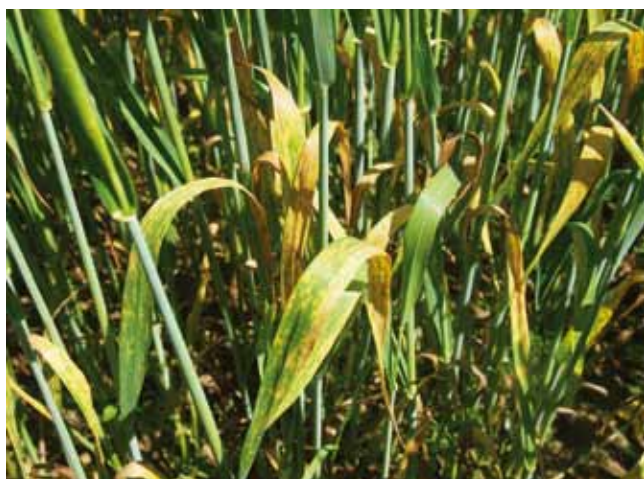
Gelbrost lässt sich im Biolandbau nur über die Wahl resistenter Sorten vorbeugend vermeiden.

Auch die Wahl der richtigen Sorte ist im Biolandbau ein Grundpfeiler des pflanzenbaulichen Erfolgs. Über die Nutzung der vorhandenen Krankheitsresistenzen lassen sich viele Pflanzenschutzprobleme vorbeugend lösen.