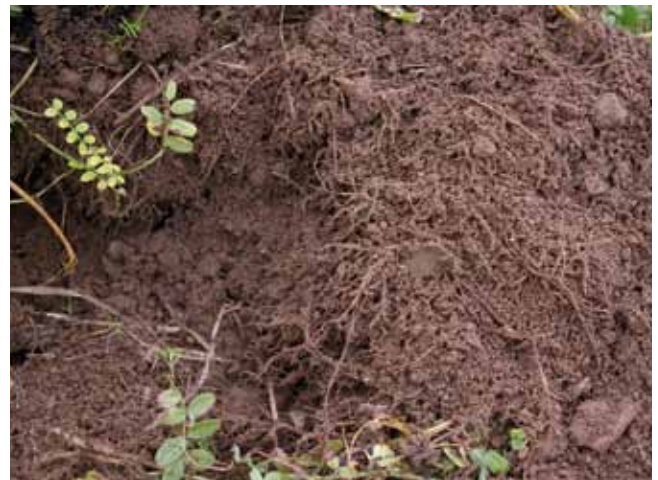
Über einen möglichst engen Wurzel-Bodenkontakt mit entsprechend großen reaktiven Oberflächen werden von der Wurzel Assimilate in die Rhizosphäre abgegeben und im Gegenzug Bodennährstoffe mobilisiert und aufgenommen.

Ergänzungsdünger sollten nur nach Bodenuntersuchung und eventuell in Verbindung mit einer Blattanalyse bei Vorliegen einer Mangelsituation eingesetzt werden. Häufig sind Mangelsituationen für die Kulturpflanze eine Folge von Bodenverdichtungen und schlechter Durchwurzelbarkeit am Standort. Aufgrund des Fehlens leichtlöslicher Mineraldünger kommt im Biolandbau der Ausbildung einer möglichst großen Wurzelmasse – in Verbindung mit einer Mykorrhizierung der Feinwurzeln – zentrale Bedeutung zu. Der Bodenwissenschaftler Edwin Scheller hat in dem Zusammenhang den Begriff „aktive Nährstoffmobilisierung“ geprägt.