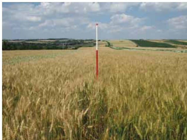
Die alte Sorte Capo (links im Bild) ist seit vielen Jahren im Biolandbau erfolgreich. Die neuere Züchtung Tobias (rechts im Bild) übertrifft Capo im Kornproteingehalt deutlich.

Zusätzlich hilft die Wahl der richtigen Sorte dabei, die Qualitätsanforderungen in der Biovermarktung leichter zu erreichen.