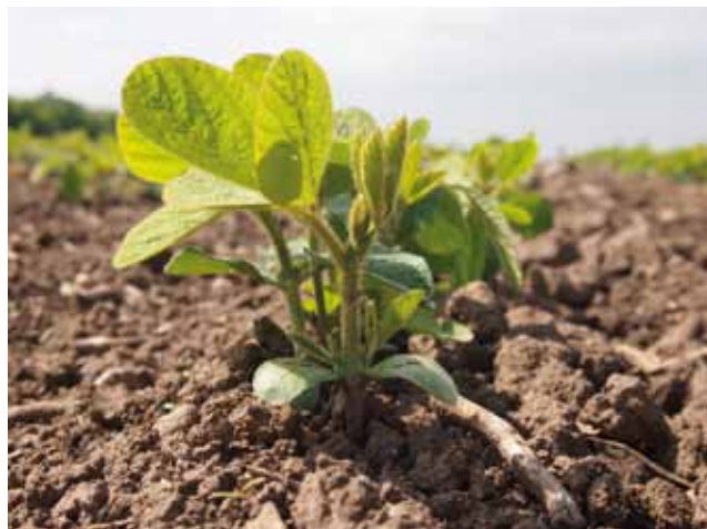
Die Sojabohne weist meist eine negative Stickstoffflächenbilanz auf.

Körnerleguminosen (Körnererbse, Ackerbohne, Wicke, Lupine ...) haben einen geringeren Vorfruchtwert als Futterleguminosen und brauchen Fruchtfolgeabstände von 6 Jahren und mehr als Vorbeuge gegen Fußkrankheiten. Einen Sonderfall stellt die Sojabohne dar, die derzeit noch eine relativ hohe Selbstverträglichkeit aufweist. Andererseits entzieht die Sojabohne über das Erntegut mehr Stickstoff als sie über die Wurzelknöllchen assimiliert, so dass sie im Biolandbau häufig zum Stickstoffzehrer wird.