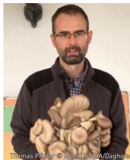
Thomas Pfister © BIO AUSTRIA/Daghofer

pro Teilnehmer 1-2 Stück frisches Laubrundholz mit Rinde, 1 m lang und ca. 10-15 cm Durchmesser, Schreibmaterial.