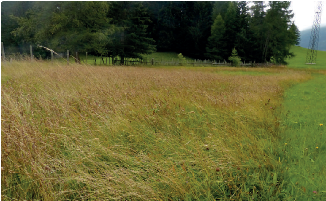
überständige Wiese mit strohigen Obergräsern