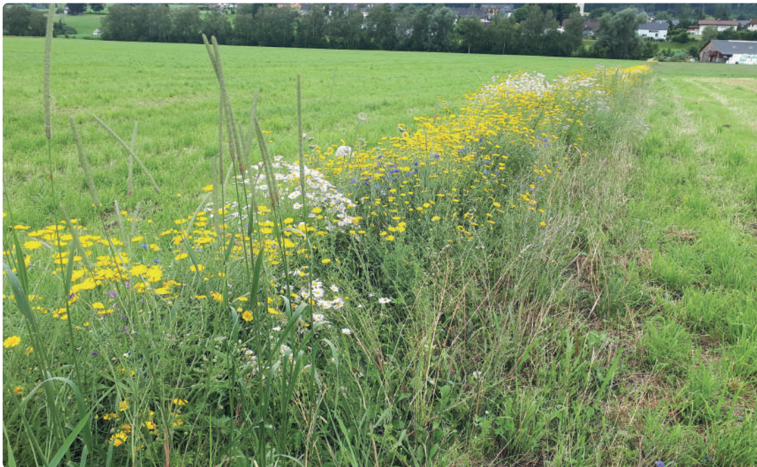
Färberkamille, Hundskamille und Kornblume