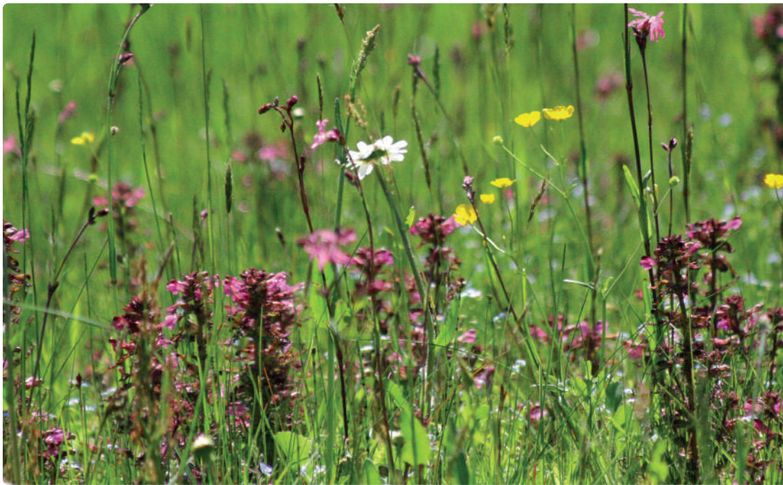
Margerite, Kuckucks-Licht- nelke, Ruchgras, Scharfer Hahnen- fuß