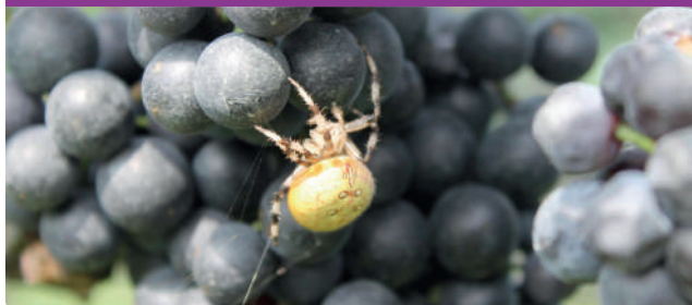
Biodiversität im Weinbau fördern