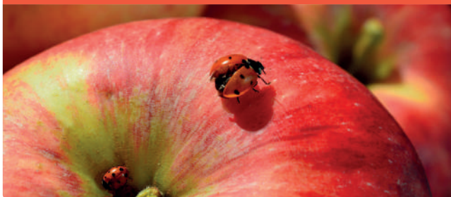
Biodiversität im Obstbau fördern