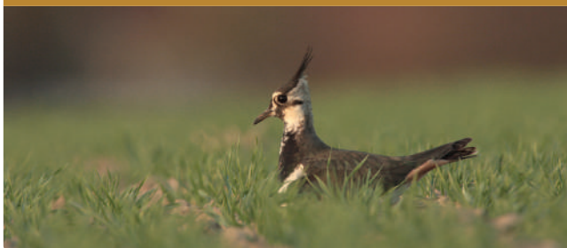
Biodiversität am Acker fördern