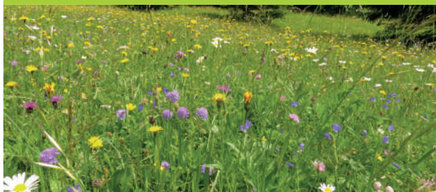
Biodiversität im Grünland fördern