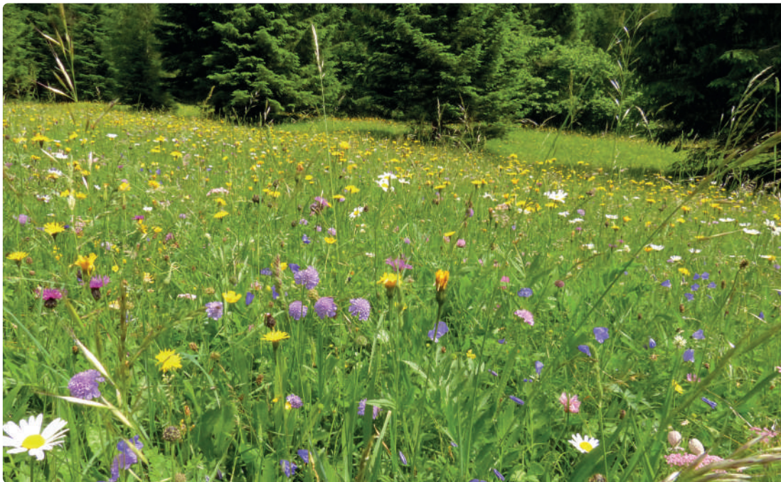
Magerwiese: Aufrechter Trespe, Rauh-Löwenzahn, Witwenblume, Margerite, Aufgeblasenes Leimkraut, Wiesen-Glocken- blume, Wiesen- Flockenblume