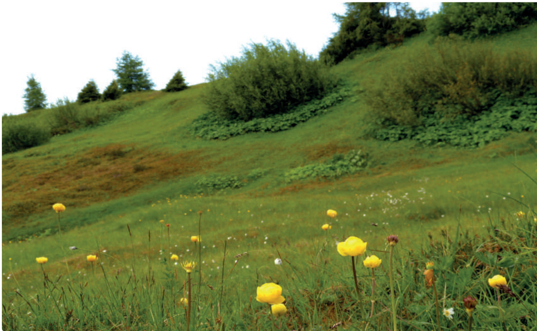
Feuchtfläche mit Trollblume und Wollgras