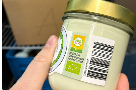
BIO AUSTRIA Schuler

und prüfe gemeinsam mit dir, ob die Bio-Kennzeichnung korrekt umgesetzt ist. Wenn du neu mit dem Ab-Hof-Verkauf startest oder neue Produkte entwickeln möchtest, können auch die Musteretiketten der Landwirtschaftskammer eine hilfreiche Orientierung sein (siehe Infokasten rechts).