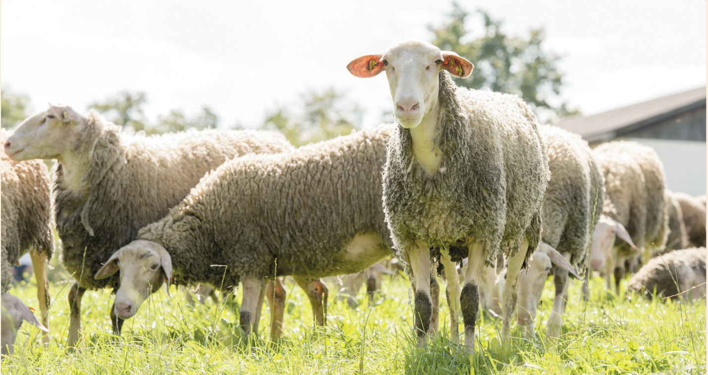
BIO AUSTRIA Fuchs