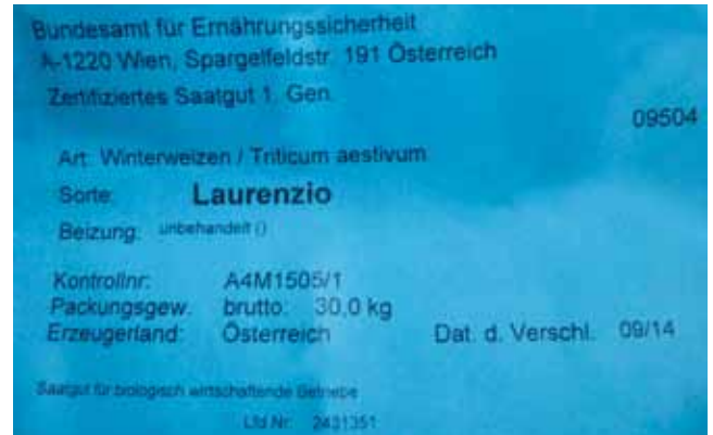
Die Saatgutetikette dient als Nachweis für den Einsatz von Biosaatgut und muss für die Biokontrolle aufbewahrt werden!

ACHTUNG: Im ersten Umstellungsjahr dürfen Sie kein Eigennachbausaatgut einsetzen (es handelt sich um konventionelles Saatgut), außer es ist am Markt kein Biosaatgut verfügbar.