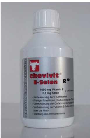
Abb. 4: Chevivit E-Selen® biotaugliches Ergänzungsfuttermittel – enthält Vitamin E und Selen

Futtermittel sind eindeutig auf der Verpackung und/oder auf dem Sackanhänger als solche gekennzeichnet, auch jene, die von Tierärzten abgegeben werden (z. B. Ergänzungsfuttermittel, Diätfuttermittel).