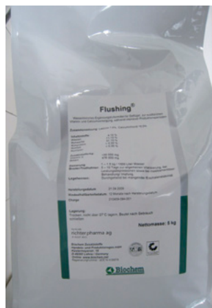
Abb. 6: Flushing – Ergänzungsfuttermittel

zwar ebenfalls Vitamin E und Selen als Wirksubstanzen enthält, aber als biotaugliches Futtermittel eingestuft ist.