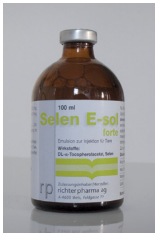
Abb. 5: Selen E-sol®-Arzneimittel – enthält Vitamin E und Selen

Das Injektionspräparat Selen E-Sol® (rechts, Abb. 5) ist ein Arzneimittel, während das über das Maul zu verabreichende Präparat Chevivit E-Selen® (links, Abb. 4)