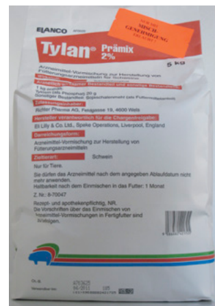
Abb. 7: Tylan – Arzneimittel mit Antibiotika

Tylan ist ein Arzneimittel, Flushing ist ein nicht biotaugliches Ergänzungsfuttermittel.